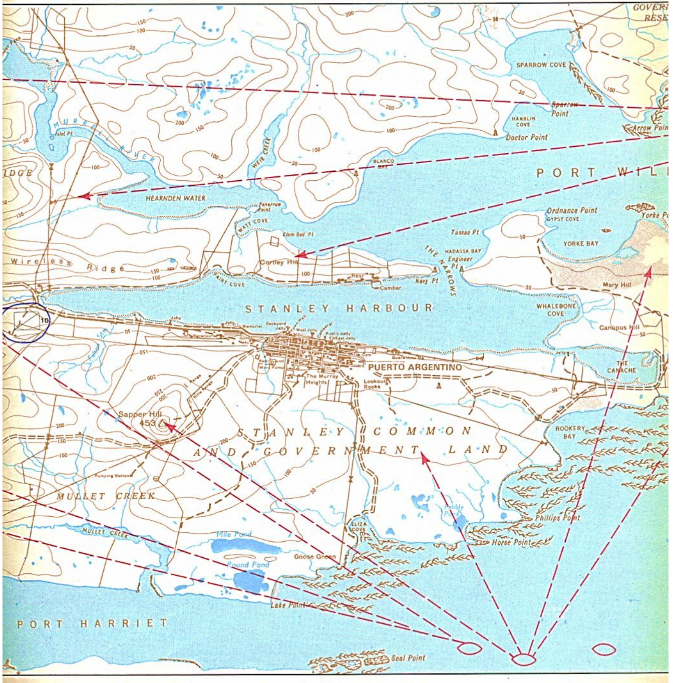
Anexo 54 parte 2